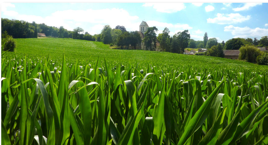
Village de Neuville-Bosc